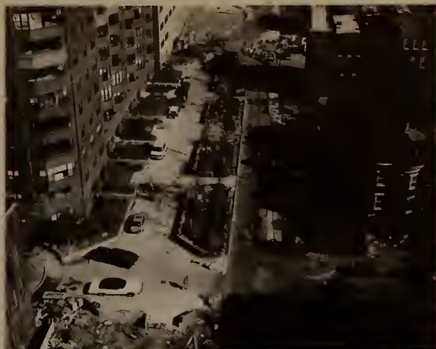
View of Copley Deck, showing Southwest Corridor Project landscaping and site improvements, adjacent to Copley Residences and the West Canton/Harcourt/Yarmouth St. area.

Station Area Task Force groups for Green Street, Ruggles Street and Back Bay Stations have participated in the process for the preparation of developer kits for the proposed housing sites within their station area, and will be involved in the future selection of devel-